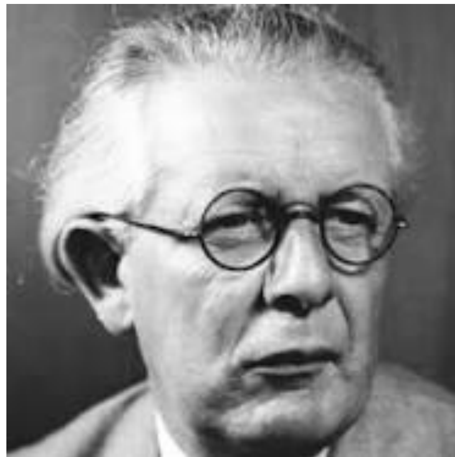
(Piaget - Psicologo)

la conoscenza si basa sull'interazione pratica del soggetto con l'oggetto